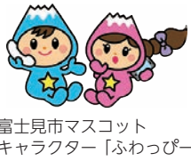
富士見市マスコット キャラクター「ふわっぴー」