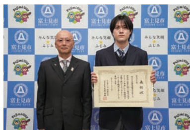
NPO法人彩の国自然学校C'S