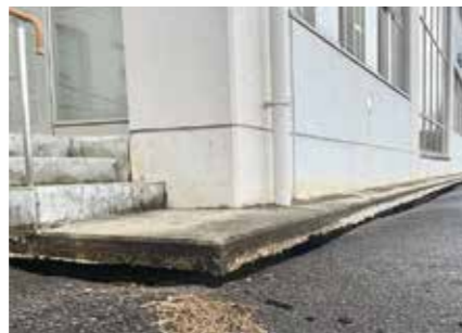
▲地面と建物に隙間が生じ、避難所として使用できなかった体育館