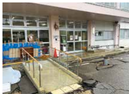
▲建物周辺の地面が隆起し、路面にひび割れが発生

令和6年1月1日に発生した令和6年能登半島地震の被災自治体を支援するため、市は県と連携し、石川県七尾市へ職員を派遣しました。現地の状況から災害への備えの必要性など、派遣職員によるレポートをお届けします。