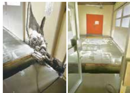
▲校舎と体育館をつなぐ渡り廊下に生じた30cmほどの段差