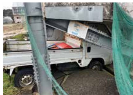
▲隆起した地面と建物に挟まれた車両