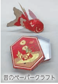
昔のペーパークラフト