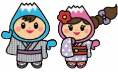
富士見市マスコットキャラクター「ふわっぴー」