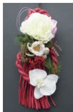
わらのお正月飾り お正月リースアレンジ