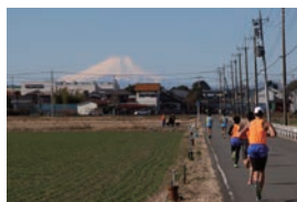
前回開催時の様子

申込 11月1日(水)からWebで ※スポーツエントリーへの会員登録(無料)が必要です。 ※別途利用手数料がかかります。 問 富士見市スポーツ協会 ☎ 049(254)9510