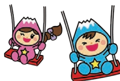
富士見市マスコットキャラクター「ふわっぴー」

掲載は受付順です。申込書は秘書広報課にあります。原則として掲載月の前々月の25日(25日が土・日・祝の場合はその前日)までにお申し込みください。