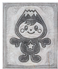
たくほんの作品例