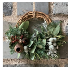
クリスマスリース