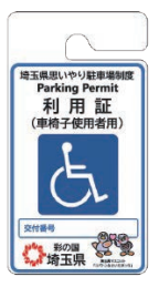
例：利用証 (車椅子使用者用)