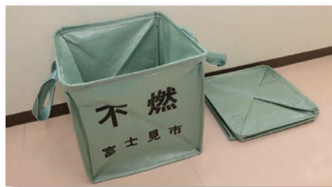
組み立てた状態(左)と畳んだ状態(右)

かごの管理でお困りの集積所や破損してしまったかごなどは、交換しますので、希望の方はお問い合わせください。