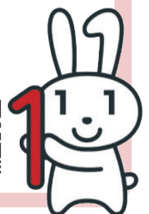
マイナンバーPRキャラクター「マイナちゃん」