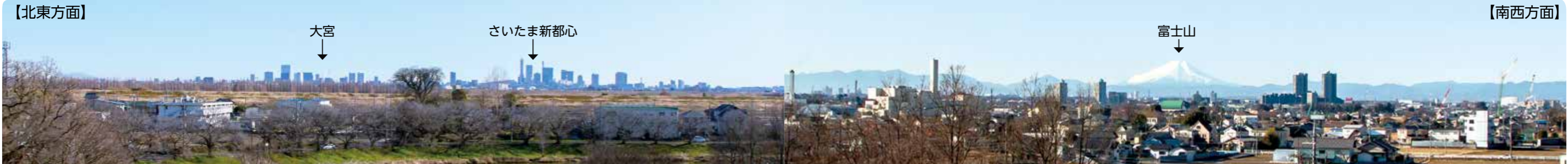
展望台から望むパノラマ。空気が澄んだ日には、南東方面に東京スカイツリー、北東方面に筑波山も見られる。