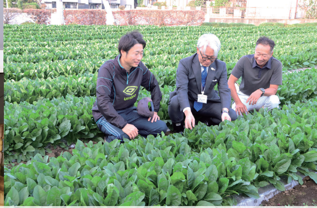
もうすぐ収穫を迎えるほうれん草