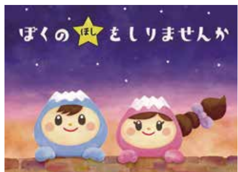
絵本「ぼくの★をしりませんか」表紙イメージ