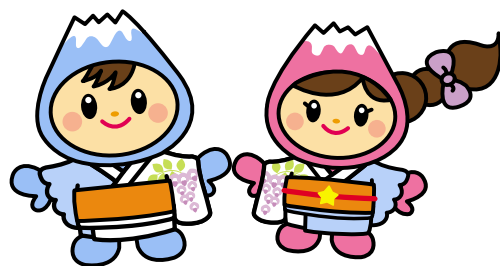
「ふ和っ服」(作者・石田さん描き下ろし)