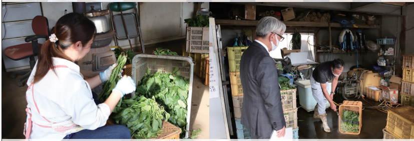
手作業で選別していきます 出荷前の洗浄作業の様子