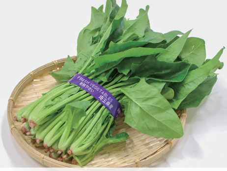
みずみずしいほうれん草 おいしいほうれん草は、緑が濃く、葉肉が厚い