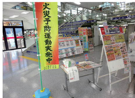
大型家電量販店における火災予防啓発品の設置