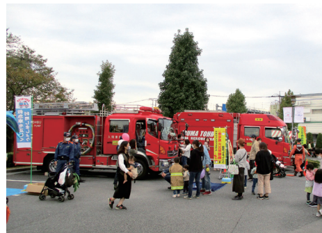
'22富士見ふるさと祭り会場にて