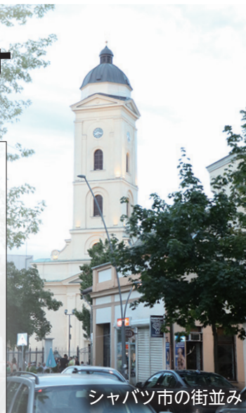
シャバツ市の街並み