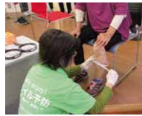
ふくらはぎ周囲長の測定のようす