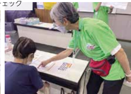
上段左からフレイル予防の説明、片足立ち上がり、握力測定 下段左から滑舌チェック、指輪っかテスト、深堀チェック