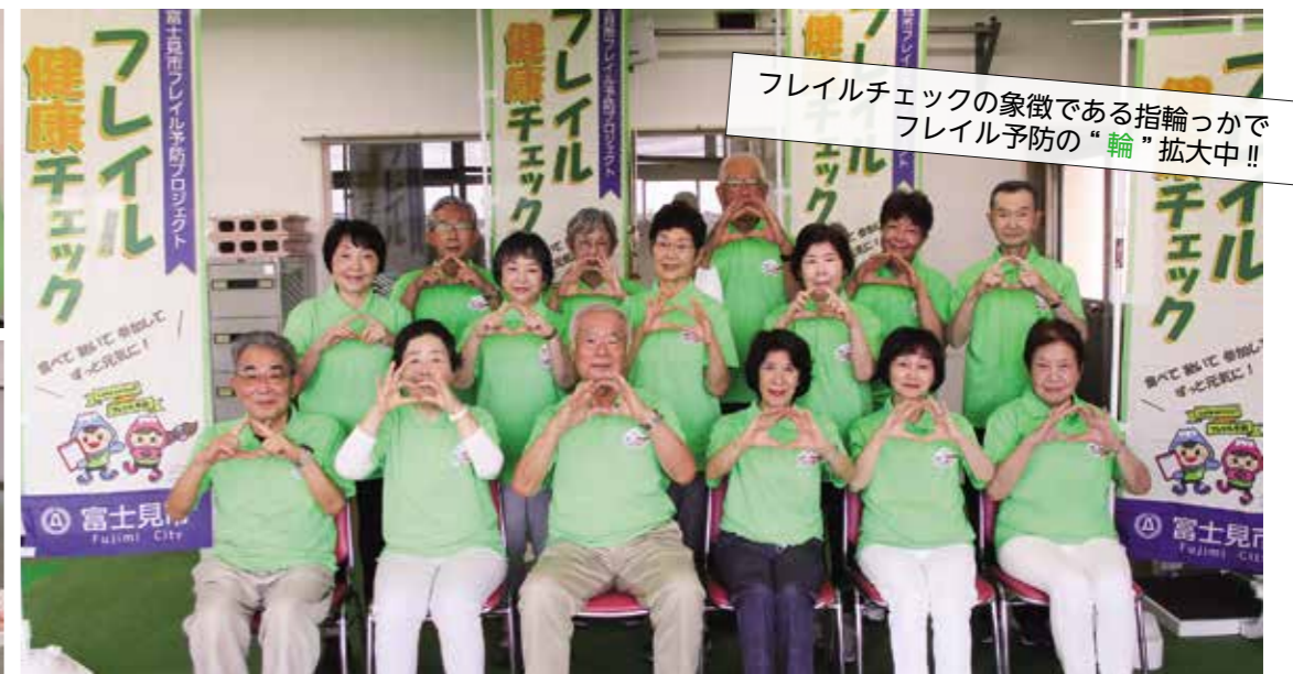
フレイルチェックの象徴である指輪っかでのフレイル予防の“輪”拡大中!!