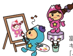
富士見市マスコットキャラクター「ふわっぴー」

10月23日(日)～26日(水)10:00～17:00(初日は13:00から、最終日は16:00まで) /キラリ☆ふじみ/作品展示：写真、絵画、書、陶芸、手工芸品、絵手紙、色鉛筆画、短歌、俳句ほか 舞台発表(25日(火))：フラダンス、ハーモニカ、カラオケ、歌声ほか/ 主催全日本年金者組合富士見支部/無料/ 小倉 ☎049-253-0037