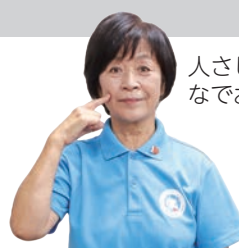
人さし指で頬をなでおろす