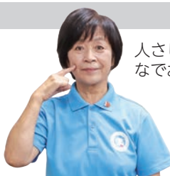
人さし指で頬をなでおろす