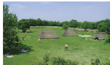
水子貝塚公園(富士見市)