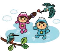
富士見市マスコット キャラクター 「ふわっぴー」

掲載は受付順です。原則として掲載 月の前々月の25日(25日が土・日・祝 の場合はその前日)までにお申し込み ください。