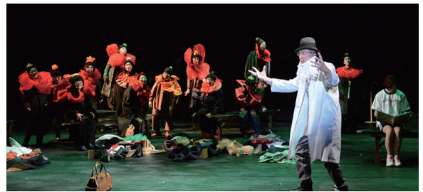
『にぎやかな夢～風～中、ひなげたちの歌』(2020)