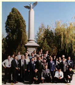
昭和58年10月の第2次 シャバツ市友好訪問団

第2次シャバツ市友好訪問団の一員としてシャバツ市を訪問したのが38年前。あの訪問がきっかけで、東京2020オリンピックのホストタウンとしてセルビア共和国選手団の招致につながったのがとても感慨深いです。