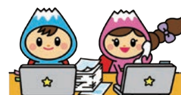
富士見市マスコットキャラクター「ふわっぴー」