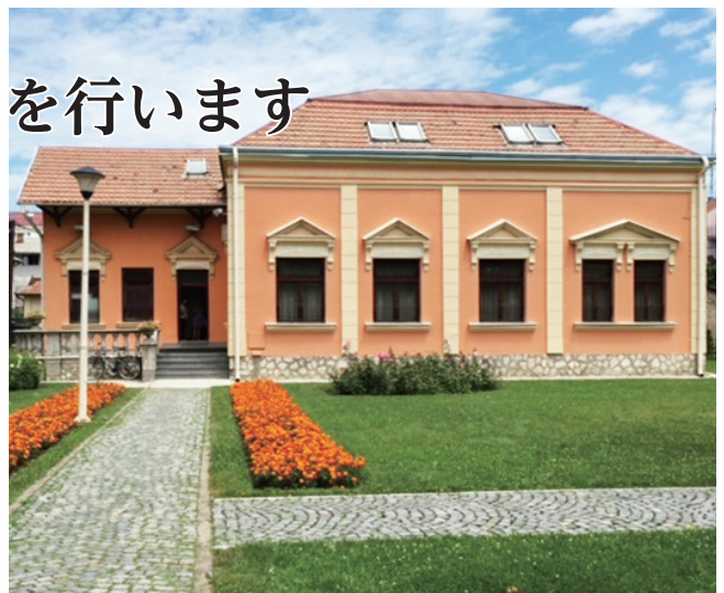
セルビア共和国シャバツ市迎賓館