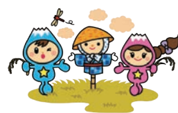
富士見市マスコットキャラクター「ふわっぴー」