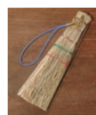
ミニぼうき ストラップ