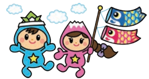
富士見市マスコットキャラクター ふわっぴー

ソフトボール ブラックパンサーズ 毎週日曜10:00～12:00/鶴瀬小学校 /18～65歳/楽しくソフトボールをして、運動不足を解消しましょう/月会費1,000円/初心者歓迎/ 塩野 ☎049-251-2026