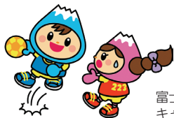
富士見市マスコットキャラクター ふわっぴー