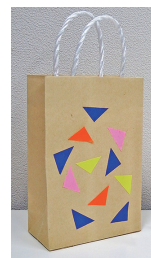
紙のミニ手さげ袋