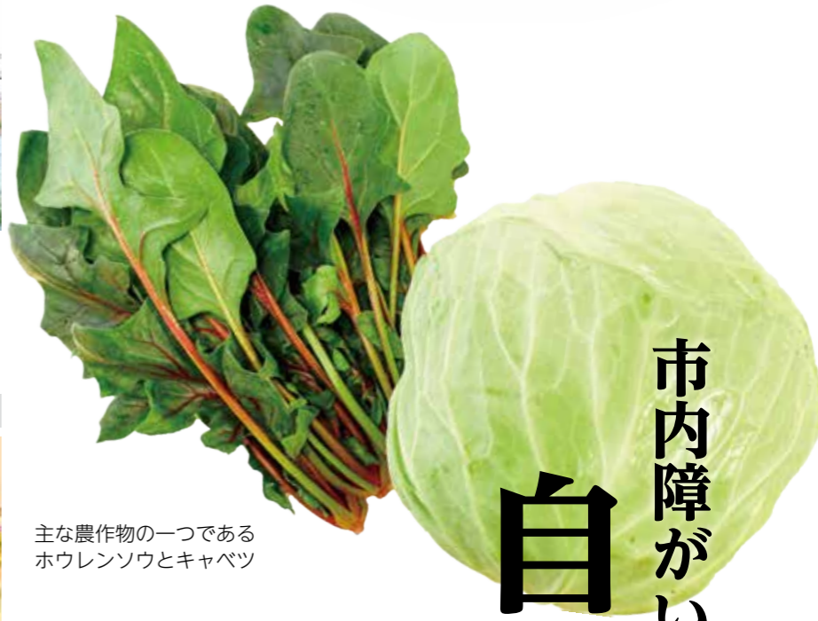
主な農作物の一つである ホウレンソウとキャベツ