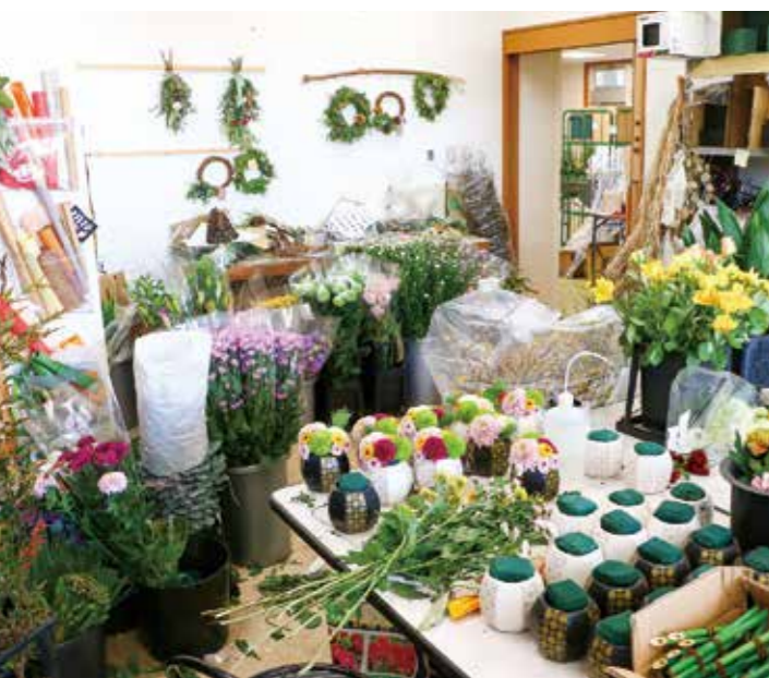
むさしの作業所の作業室