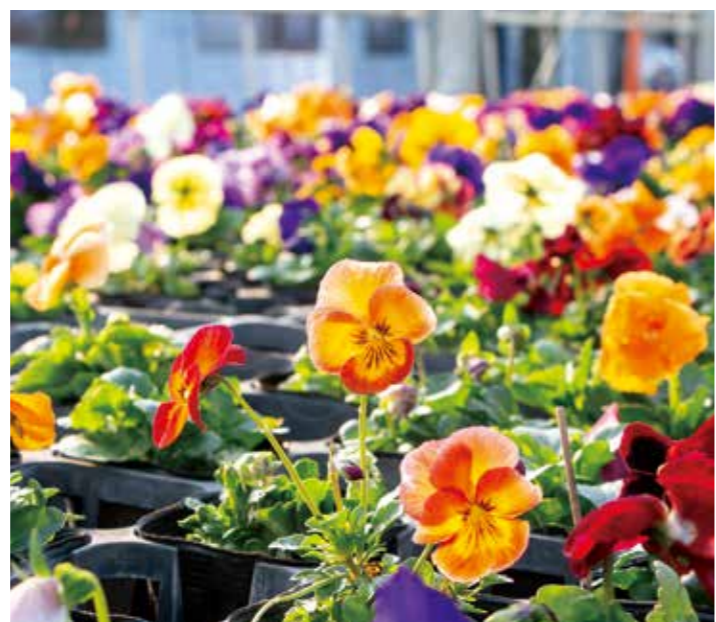
むさしの作業所のビニールハウスで育てられているパンジー