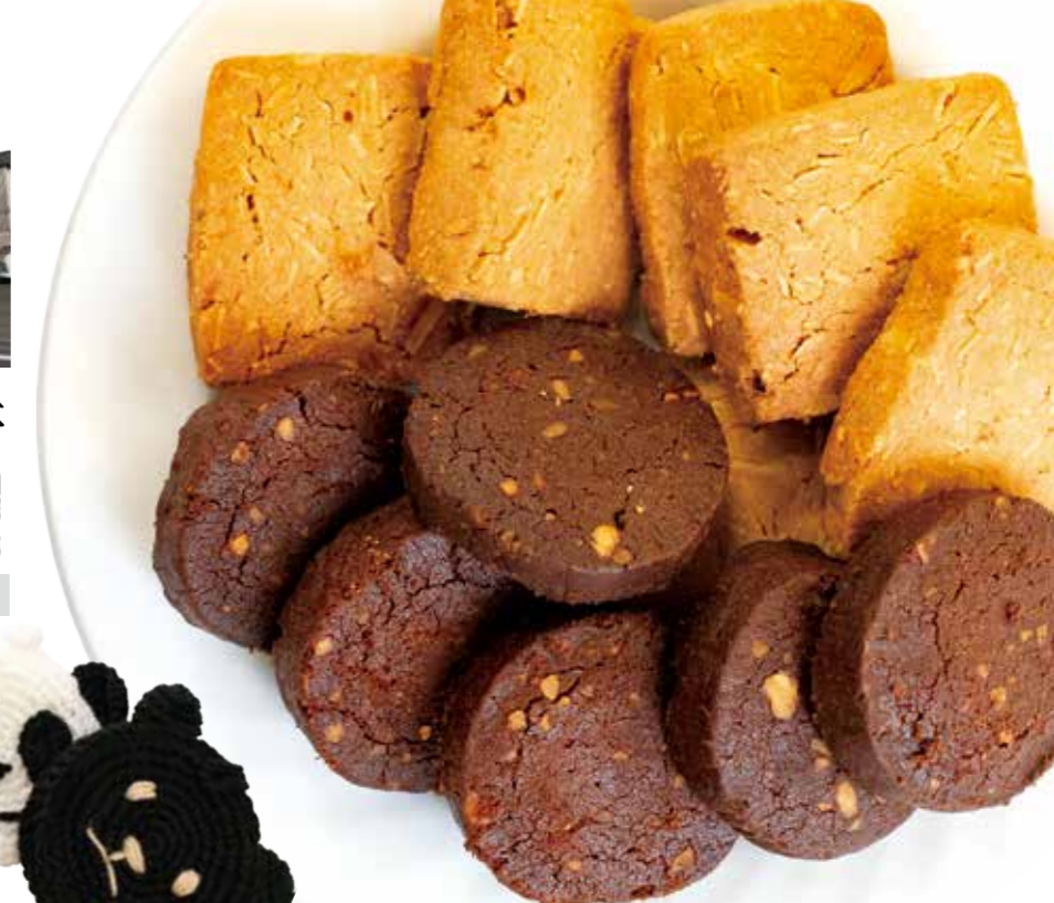
アーモンドとココアのクッキー