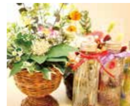
造花とハーバリウム