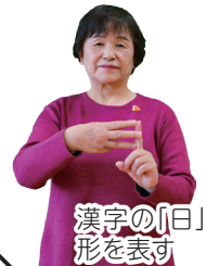
漢字の「日」の形を表す