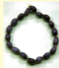
◀ジュズダマの腕輪