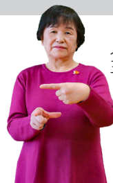
人さし指と親指で三日月の形を表す