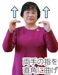
両手の指を直角に曲げる