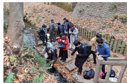
昨年の現地見学会のようす