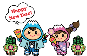
富士見市マスコットキャラクター ふわっぴー

①月4回日曜13:30～16:00②月4回月曜18:30～20:30/ふじみ野小体育館または富士見高剣道場/小1以上の男女/剣道の練習/入会金1,000円/年会費5,000円(保険代別途)/関谷 ☎090-8842-6105