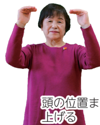
頭の位置まで上げる