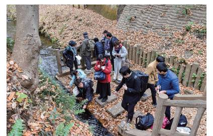
昨年の現地見学会のようす

※午前からの参加も可 定員 15人(無料、申込順) 申込 新河岸川流域川づくり連絡会(☎03-3238-9236)に電話で