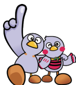
コパトン&さいたまっち