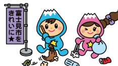
富士見市マスコットキャラクター ふわっぴー