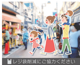
レジ袋削減にご協力ください