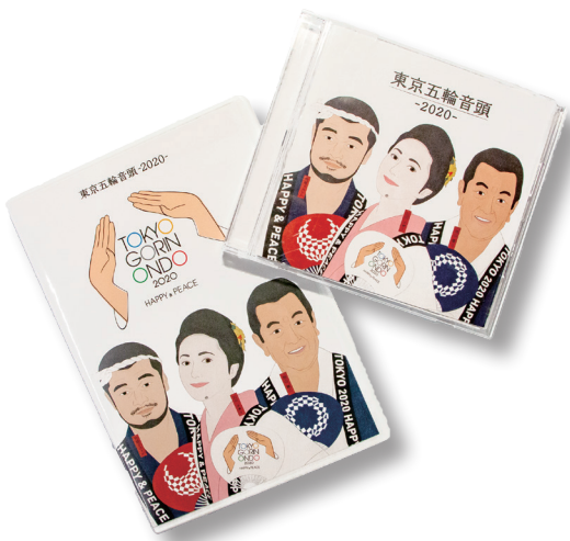
東京五輪音頭-2020-のCD・DVD

原曲である「東京五輪音頭」は、前回の東京大会の機運を高めるために昭和38年に制作され、三波春夫氏を始めとする多くのの方々 に歌い継がれてきた名曲。「東京五輪音頭」2020」は、東京2020大会招致をきっかけに、(財)東京オリンピック・パラリンピック競技大会組織委員会が新たにリメイクしたもの。 改めて東京の魅力を伝えられるよう、東京五輪音頭の曲調・歌詞を新たにするとともに、パラリンピックの要素も加え、すべての人がスポーツを楽しむことができるように、現代風アレンジと新たな振り付けが加わっている。