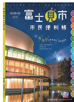
2018年版の市民便利帳

この便利帳は、地域の活性化を図るため、企業広告を掲載し、(株)サイネックスと官民協働事業で発行し、全世帯に配布するものです。この事業に伴う広告主を募集するため、(株)サイネックスの社員が皆さんの会社やお店などに伺うことがありますので、ご協力をお願いします。社員は社員証を携行しています。