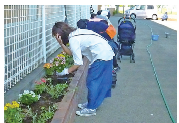
校内花壇の植え付け