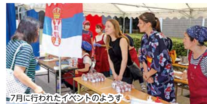
7月に行われたイベントのようす