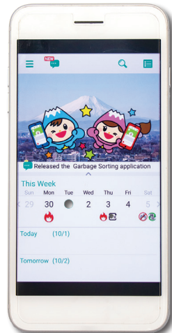
外国語版富士見ごみ分別アプリ(イメージ)