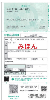
通知カード(個人番号カード交付申請書)

マイナンバーが記載されており、顔写真付きで身分証明として利用できるカードです(市では現在住民票などのコンビニ交付サービスは行っていません)。