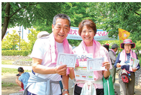
ゴール地点で完歩証が手渡されました。