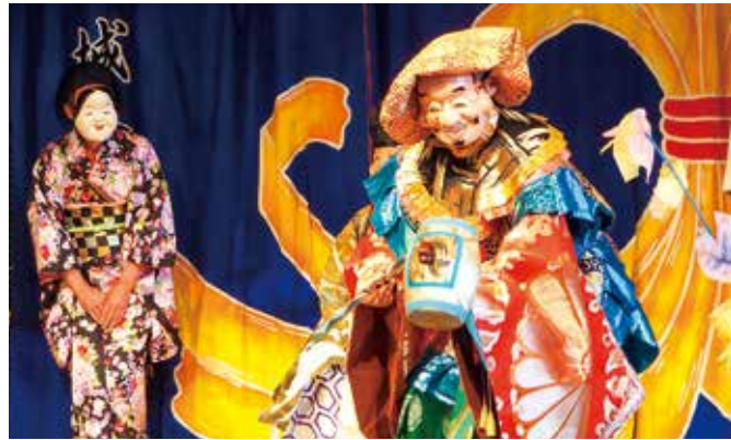
歴代高倉左近作の面を多く所有する水子城之下組囃子連

三代目は工業高校卒業後、面師への道を歩み始めました。元々は電気関係の仕事をしていました