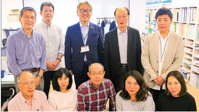
(株)ライフマスター本社スタッフの皆さん