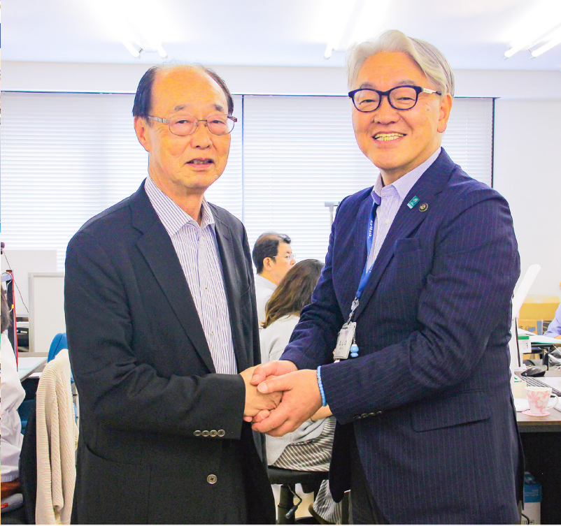
布袋田代表取締役会長と星野市長