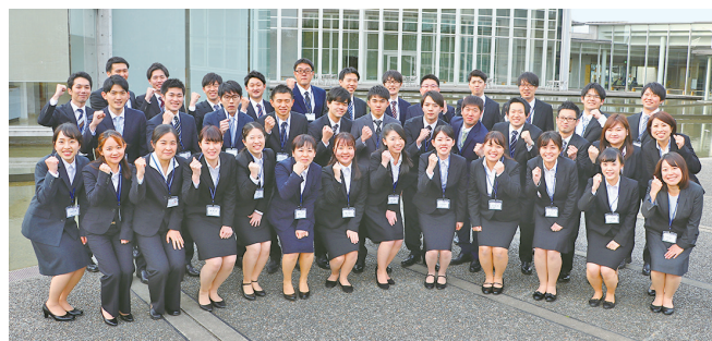
令和元年度新規採用職員の皆さん