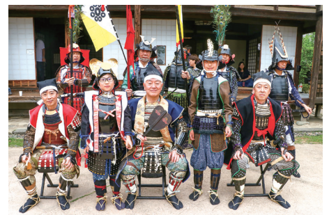
大人に混じり、子どもたちも甲冑を着て武者行列に参加しました。