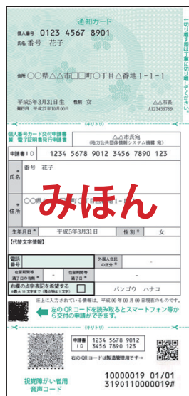
通知カード (個人番号カード交付申請書)