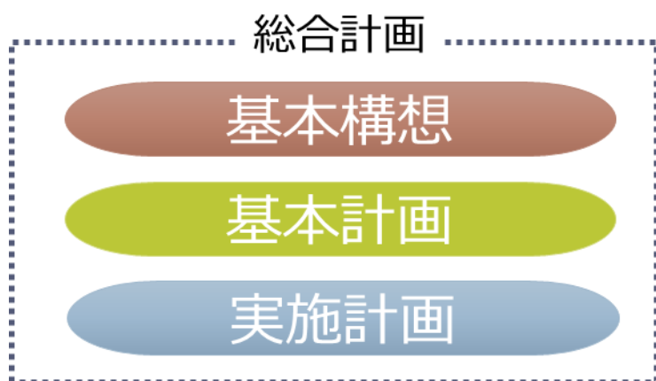
図 1-1 【総合計画の全体像】

◆今回の新たな総合計画では、“まちづくり”を持続的・効果的に進めるため、目指すべき目標（ゴール）を明確にし、共有していくことで、これまで以上に市民と行政が一体となり、市民の方の創造性や社会経験に基づく主体的な意見を反映しながら総力を挙げて取り組むこととしています。