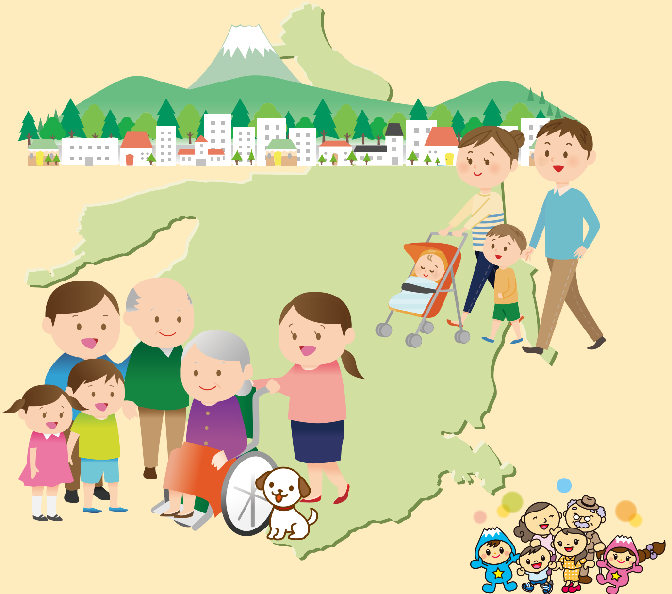
富士見市マスコットキャラクター 「ふわっぴー」