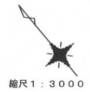
公売保留地位置図