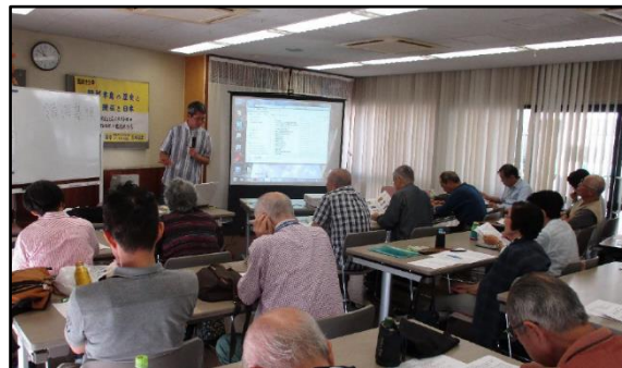
市民大学（国際社会学講座）