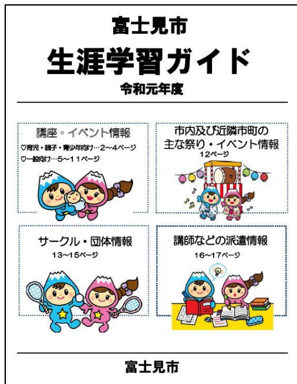
富士見市生涯学習ガイドブック表紙

生涯学習施設の整備については、利用者や地域住民の意見を反映しつつ、市の公共施設等マネジメント 17 に基づき対応する必要があります。