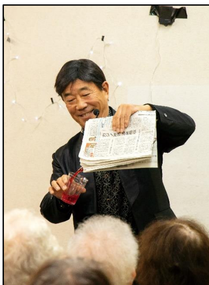
市民人材バンク (マジック)