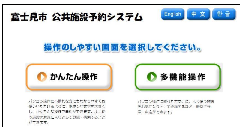
公共施設予約システムトップページ