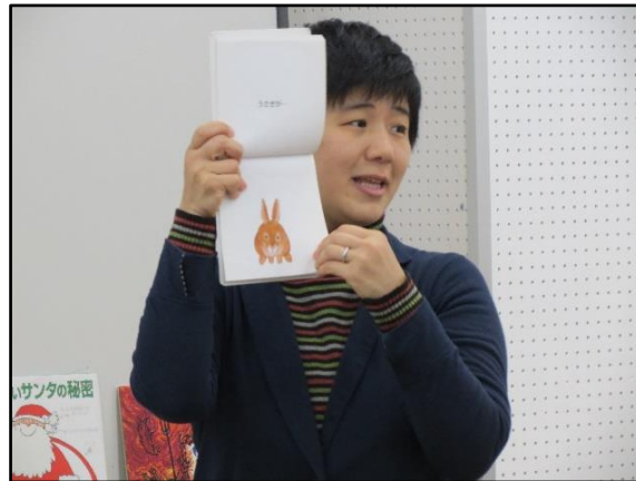
市民人材バンク（えほんの魅力発見講座）

事業への参加者や生涯学習指導者の固定化・高齢化がみられることから、周知方法の工夫等により、新たな参加者を増やす取組や指導者の育成強化が必要です。