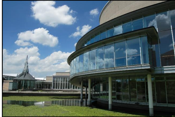
富士見市民文化会館キラリ☆ふじみ