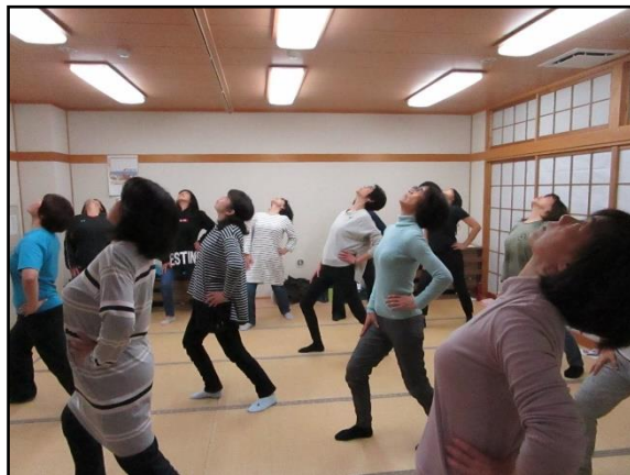
仙人体操 (水谷東公民館)