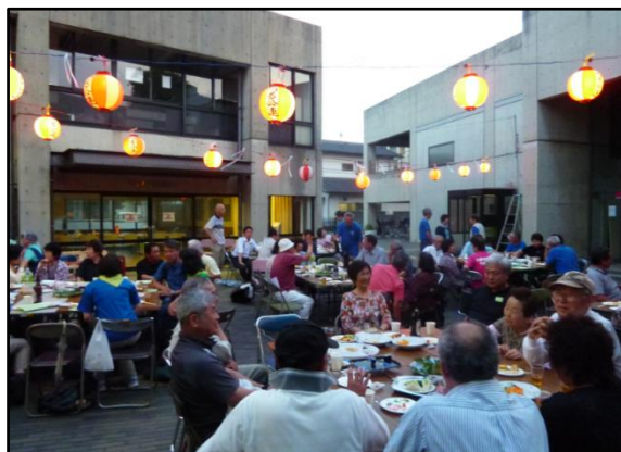
つるせ公民館祭り打ち上げ