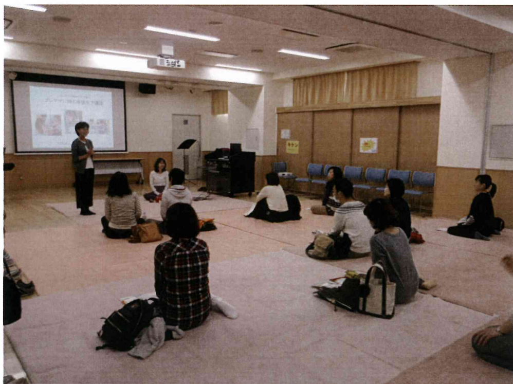
産後ケア講座・・・ムジカベベ代表から開催趣旨説明