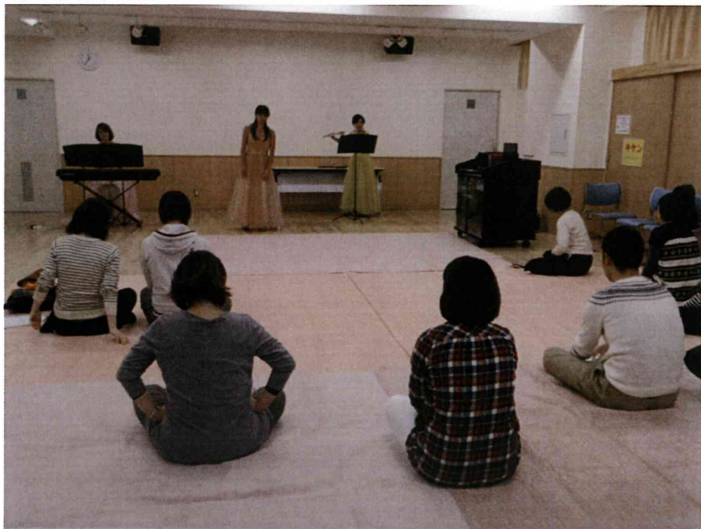
音楽会・・・胎教によさそうな歌、キーボード、フルート♪