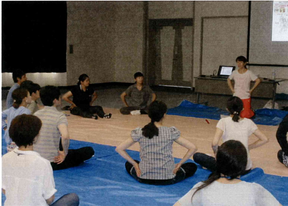
産後ケア講座・・・骨盤の体操