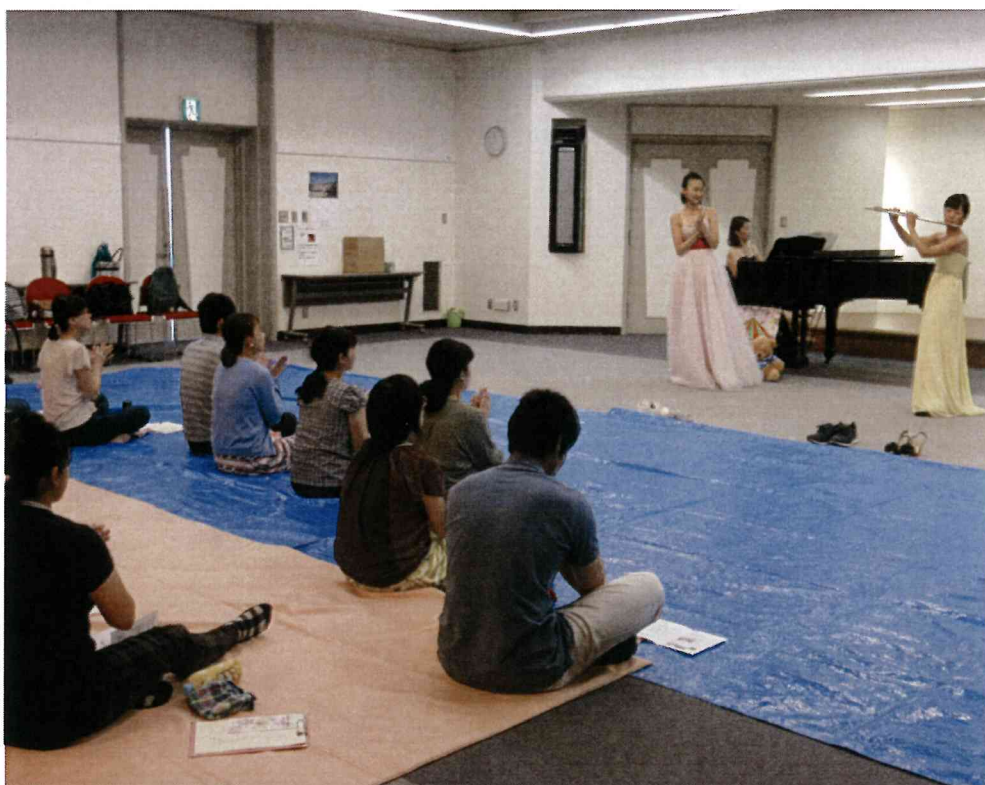
音楽会・・・歌、ピアノ、フルートの生の音楽でゆったり♪