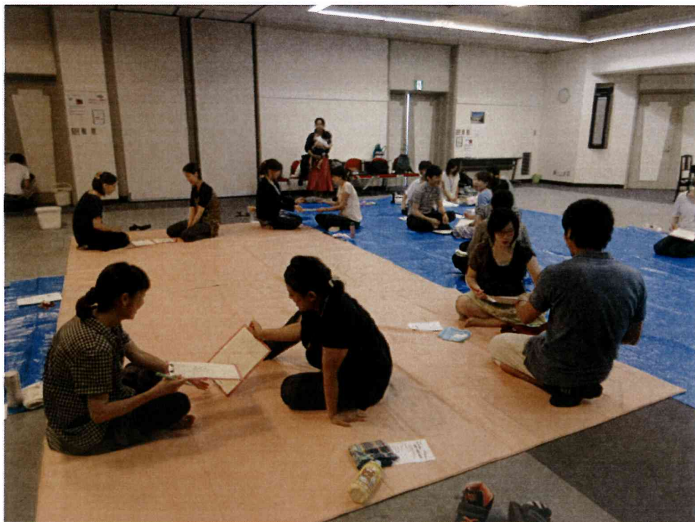
産後ケア講座・・・2人組で話そう「産後プラン」 ～どんな産後にしたい?～