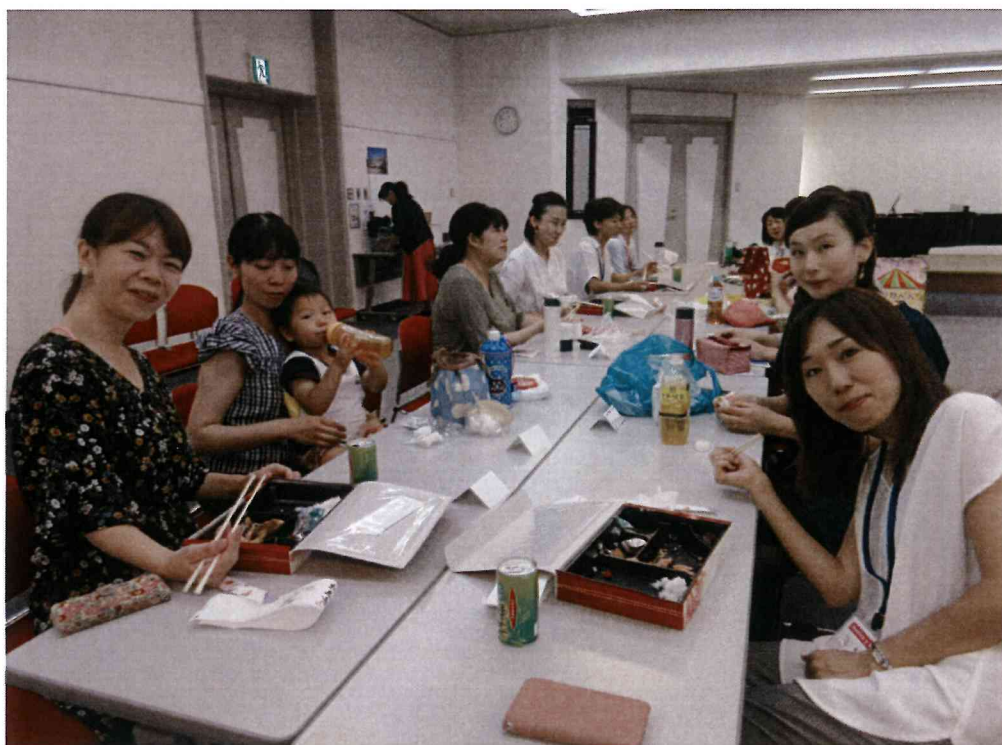
希望者によるランチ会・反省会