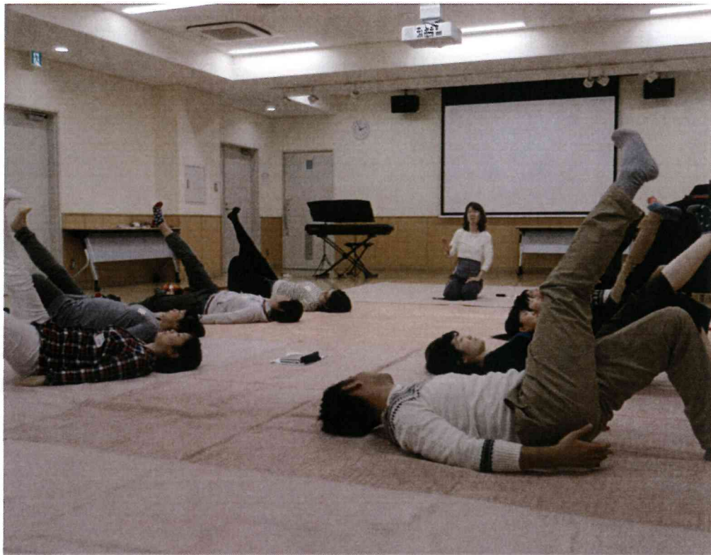
産後ケア講座・・・体操