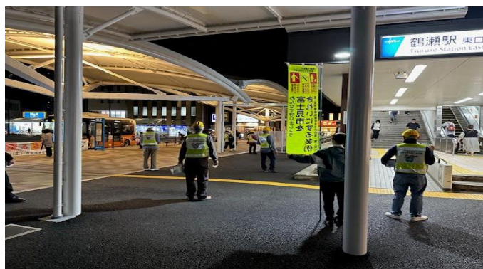
富士見市環境施策推進市民会議事業 (街頭キャンペーン)