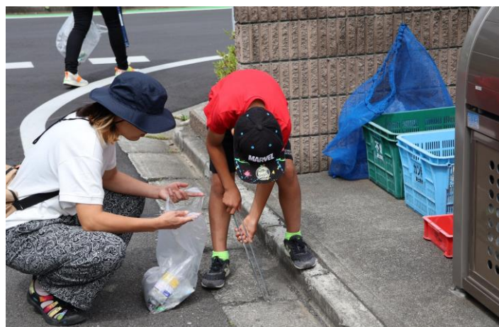
安心安全道路クリーン事業

(※3) 主に粗大ごみなど日常生活に伴って排出されるごみや、事業活動に伴って生ずるごみを定められたルールに従って適正に処理せず、処理施設以外の場所に投棄されたもの