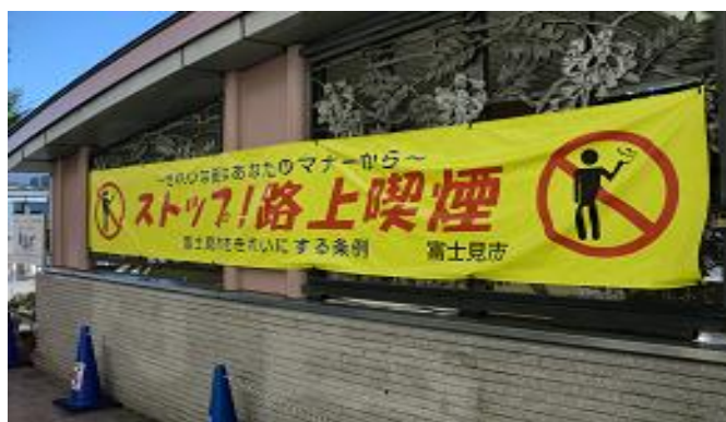
路上喫煙禁止啓発用横断幕