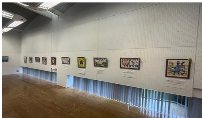
環境問題啓発ポスター展