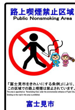
路上喫煙禁止区域の標識シール