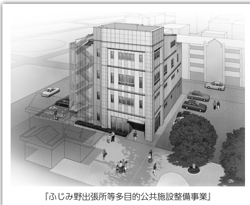
『ふじみ野出張所等多目的公共施設整備事業』