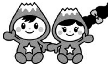
富士見市マスコットキャラクター 「ふわっぴー」