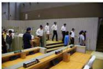
平成26年 議場で行われた 避難訓練の様子