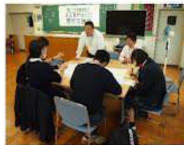
平成30年 富士見高校との 意見交換会の様子