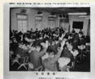
当時の 議会の様子