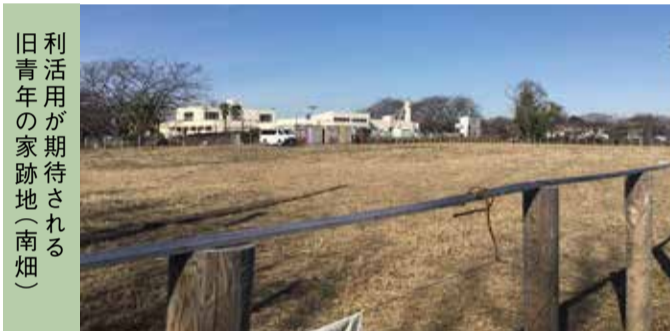
利活用が期待される旧青年の家跡地(南畑)