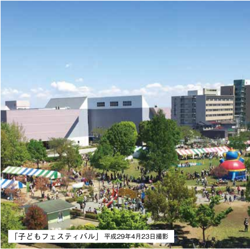
「子どもフェスティバル」平成29年4月23日撮影