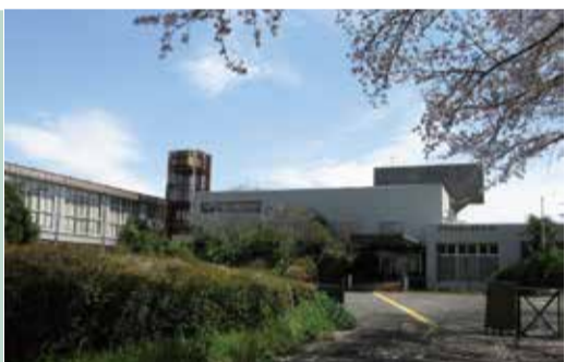
解体後の有効活用が望まれる旧富士見青年の家

本地域の自然環境やロケーションを守りつつ、さらに魅力を高めるとともに地域全体の活性化に繋げていく。