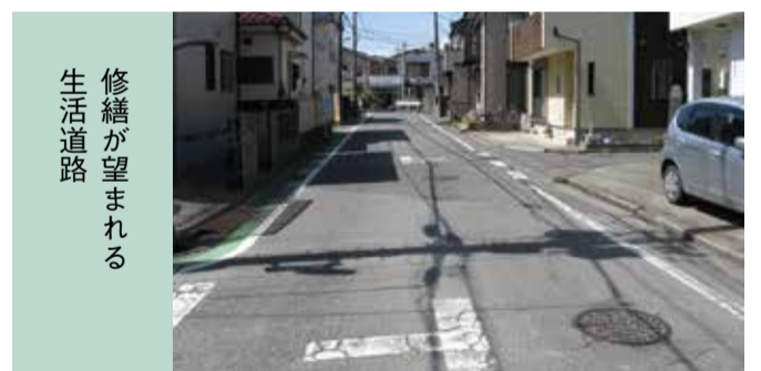
修繕が望まれる生活道路