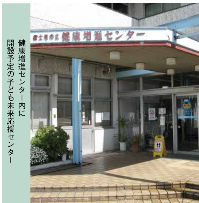
健康増進センター内に 開設予定の子ども未来応援センター