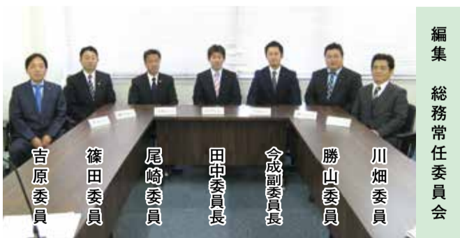
編集 総務常任委員会