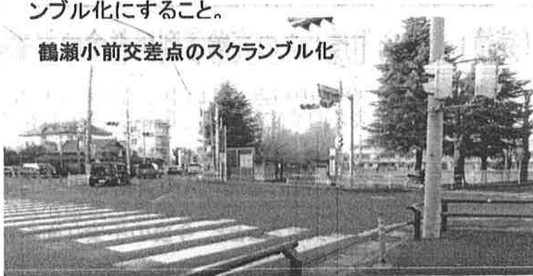
鶴瀬小前交差点のスクランブル化