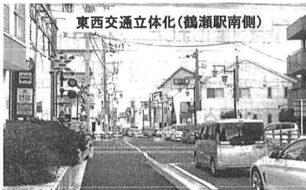
東西交通立体化(鶴瀬駅南側)