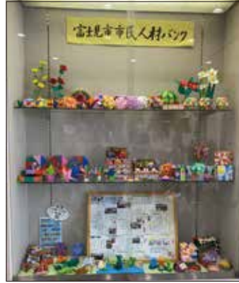
No.448 山崎 トシ子さん (7/4~7/27)