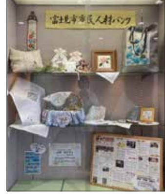
No.365 山崎 知子さん (4/27~6/23)