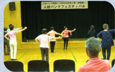
★ダンスで運動不足解消