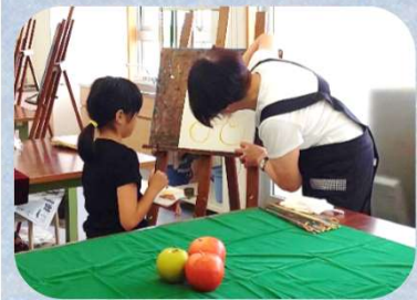
★小学生に油絵指導