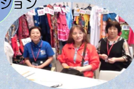
★民族衣装付補助で大活躍！