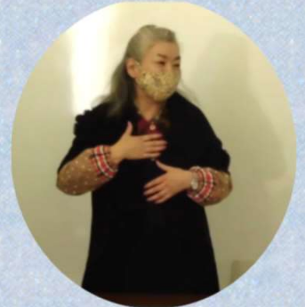
★アロマセラピーについての講義