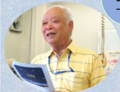
★星座についての講演です