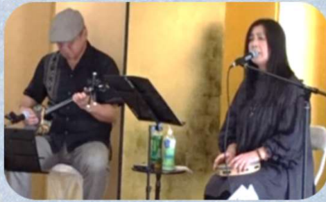
★沖縄の三線が心地よく響きます