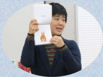
★絵本の魅力を教えてもらいました

あなたの特技はみんなの宝です。人材バンクを活用し、「人財」として、一緒に豊かな地域社会を築いていきませんか？