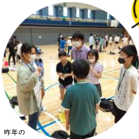
昨年の 淑徳大学探検

合い言葉は『未来の“わ” 楽しくまなぶ 富士見から』！今年はどうな体験ができるかな？