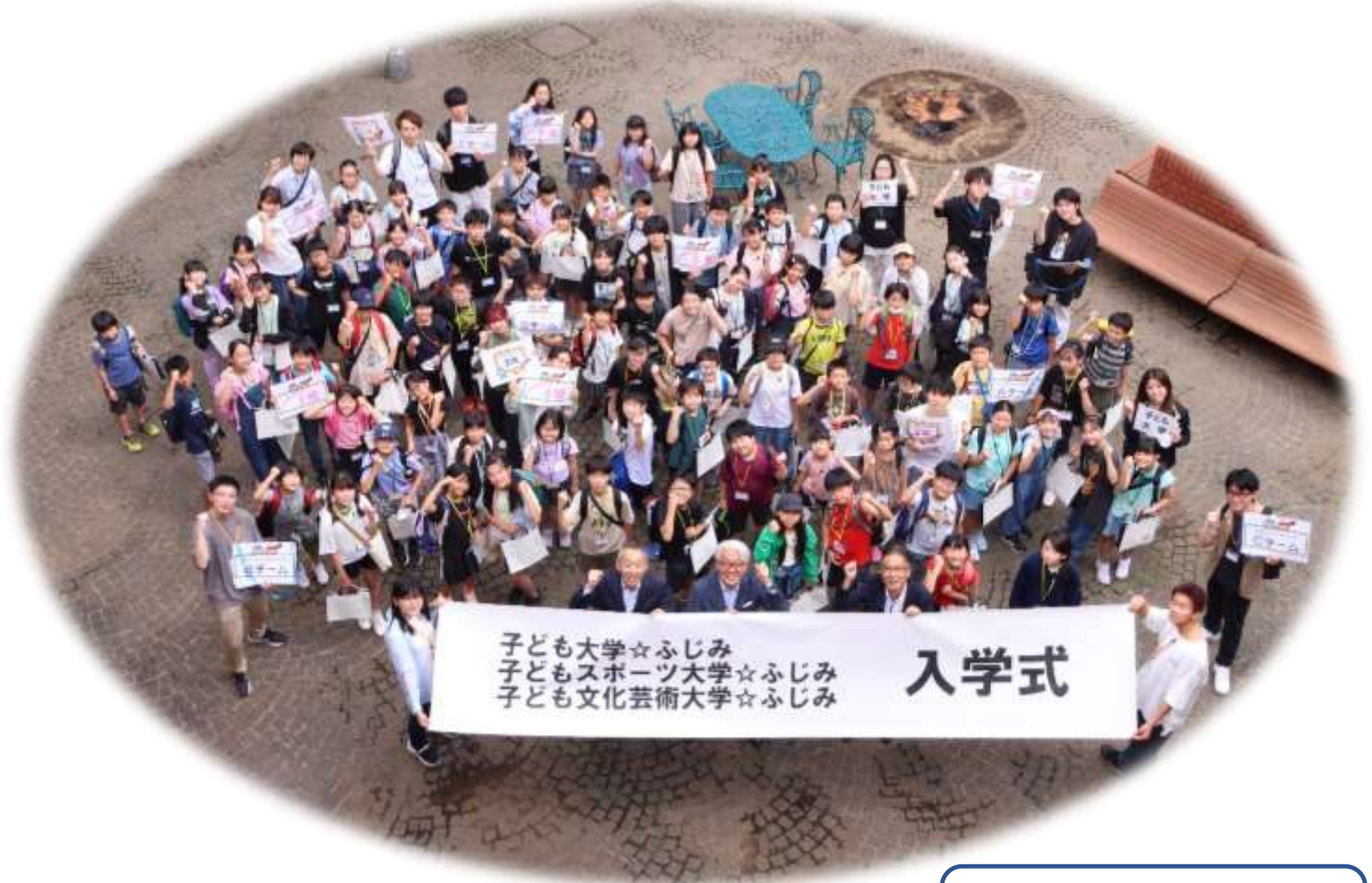
令和 5 年度入学式:全体写真