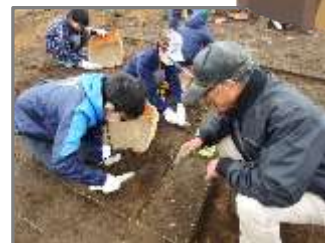
発掘調査をしてみよう