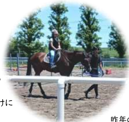
昨年の 乗馬体験の様子

やったことのないスポーツでも大丈夫!どの講義もはじめての人向けに教えるから、それぞれのスポーツの基本を楽しみながら学べるよ!