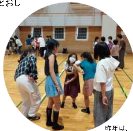
昨年は、 立教大学の先生が体で表現することを 教えてくれました。 ↑ティッシュを隣の人に繋いでいるよ。

立教大学や跡見学園女子大学、日本薬科大学など、本物の大学の先生が、専門的なおはなしを楽しく教えてくれるよ☆ 他にも国立国語研究所や、市内にある会社のみなさんなど、いろいろな先生から様々なことを教えてもらう予定です! ここ富士見市で、たくさんのことを楽しく学んで、未来への“わ”を広げよう!