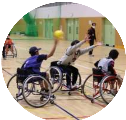
車いすハンドボールに挑戦してみよう!