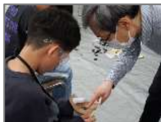
大学教授から学ぶ様子