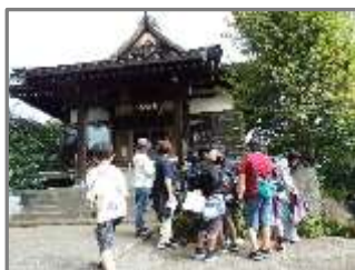
遺跡のある場所を探そう