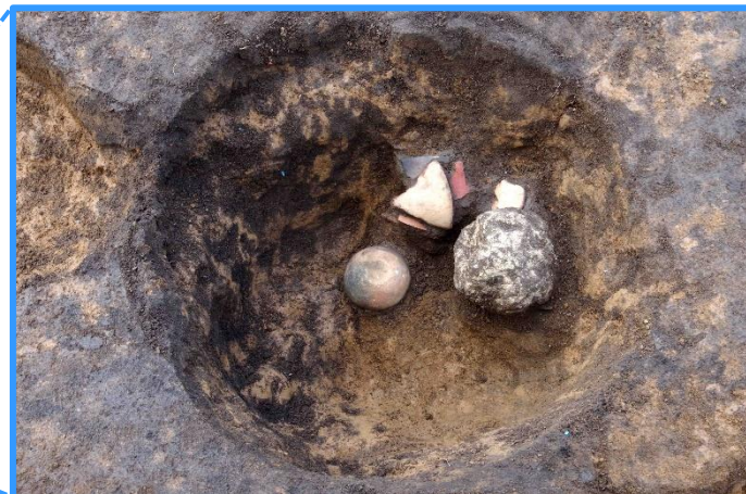
竪穴住居跡の貯蔵穴から、 土器や灰白色の粘土塊が出土した様子