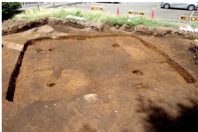
弥生時代後期～古墳時代初頭の竪穴住居跡 一辺が約6～7mを測る方形。