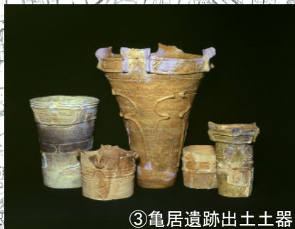
③亀居遺跡出土土器