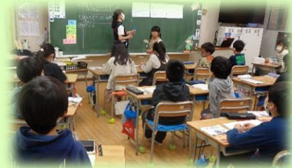
算数で真剣に話し合う3年生