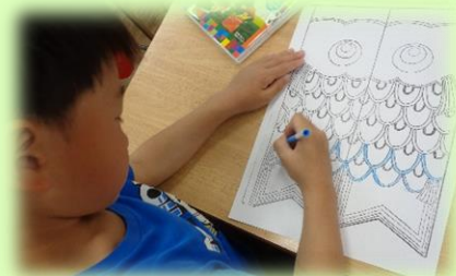
楽しく授業に取り組む1年生

今月もつるせ台小学校の教育活動へのご理解ご協力をどうぞよろしくお願いいたします。