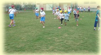
ハッピータイムでみんな仲良し

10月もつるせ台小学校の教育活動へのご理解ご協力をどうぞよろしくお願いいたします。