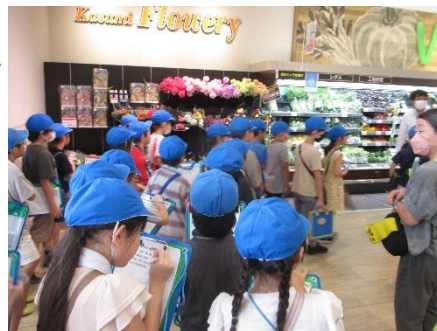
3年生 社会科見学見守り