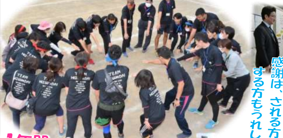
感謝は、される方も する方もうれしいね

卒業式前日の地震では、どの学年も素早い対応で訓練の成果が見られました。 お別れの会を進行する4年生、式場を整美する5年生の姿に、この時期ならではの成長を強く感じました。6年生からは教職員へのサプライズも。