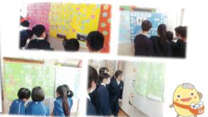
石川県七尾市立和倉小学校

みずほ台小学校のみなさんから心温まる応援メッセージをいただき、感謝の気持ちでいっぱいです。和倉っ子はとても喜んでいました。復興に向けてみんなで力を合わせて頑張ります。本当にありがとうございました。